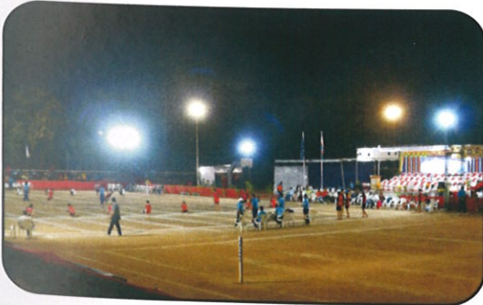
पश्चिम विभागीय आंतर विद्यापीठ महिला खो-खो स्पर्धेची क्षणचित्रे