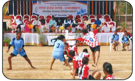
पश्चिम विभागीय आंतरविद्यापीठ महिला खो-खो स्पर्धेची क्षणचित्रे